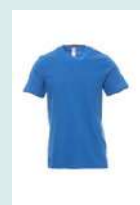
LIGHT BLU ROYAL